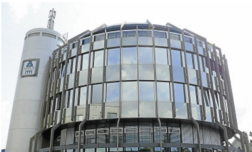
Im vierten Stock des Bisping-Rundhauses an der Weseler Straße 561 arbeitet das Team der Kroos Vermögensverwaltung.

Diese Nähe zum Kunden erfordert viel Zeit und Aufmerksamkeit. Daher ist das Unternehmen stets auf der Suche nach motivierten und gut ausgebildeten Mitarbeitern, die sich harmonisch in das Team einzufinden verstehen. Gemeinsam mit neuen Kräften können dann die zukünftigen Aufgaben und das weitere Wachstum des Unternehmens erfolgreich gemeistert werden. Schließlich ist es eine große Vision der Kroos Vermögensverwaltung AG, die Kontinuität soweit auszubauen, dass die Anleger im Hause Kroos von Generation zu Generation über viele Jahre hinweg kompetent betreut werden.